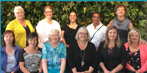
Représentantes des maisons à la CdP